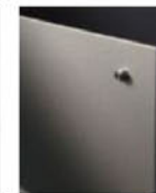
ステンシルバー色 (SC)