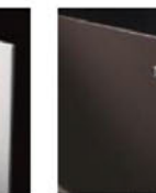
エイジングブラウン色 (MA)