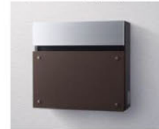
エイジングブラウン色 (MA)