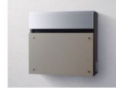
ステンシルバー色 (SC)