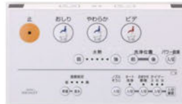
ウォシュレット用リモコン TCM1396

※男子小用時(立ち姿勢)はオート便器洗浄しません。 "ウォシュレット"はTOTOの登録商標です。